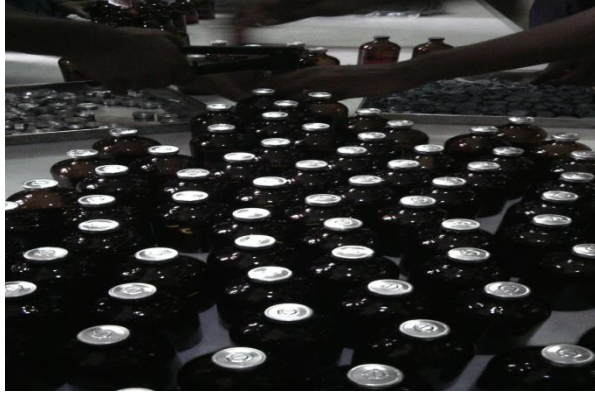
Capping of Diluent bottle after filling

ভারপ্রাপ্ত কর্মকর্তা গামবোরো টিকা শাখা প্রাণিসম্পদ গবেষণা প্রতিষ্ঠান, মহাখালী, ঢাকা ।