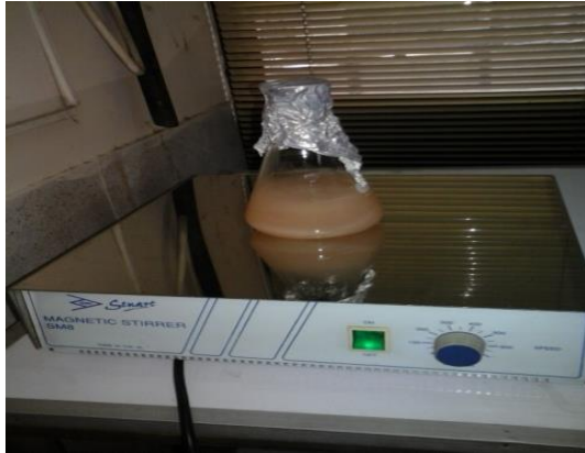
Armed flask containing chopped embryo, Trypsin and PBS placed on Magnetic stirrer for 30 minutes