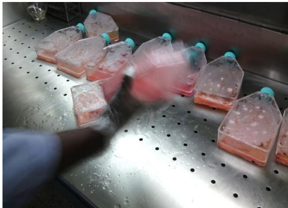
Flasks containing infected cells culture out of the freezer for thawing