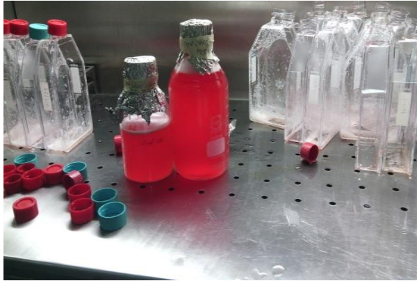
Harvation and collection of Viral fluid in bottle