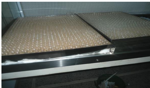
3 ml vials fitted on trays for lyophilization of liquid vaccine\