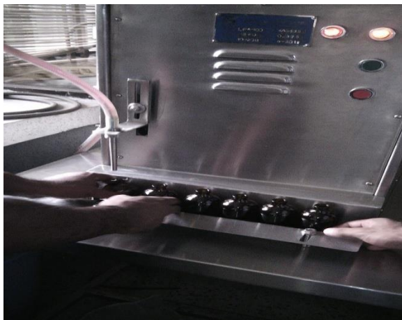
Filling of Diluents to 100 ml bottle