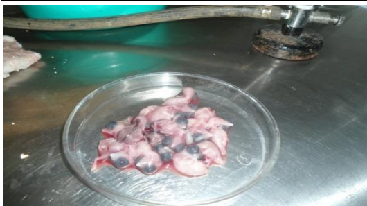
Collected embryos on petridish