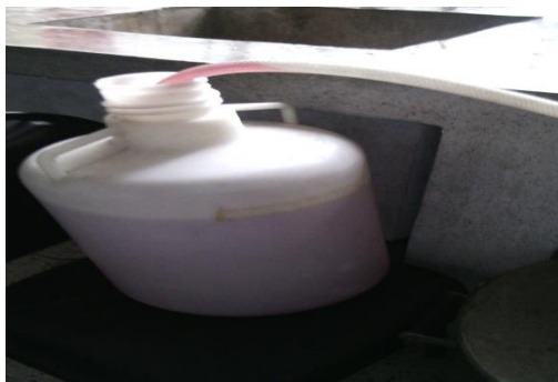
Prepared diluent in a big Jar