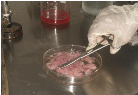
Chopping of embryos