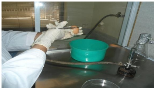
cutting of egg shell at air sac region