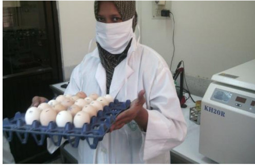
collection of fertile egg